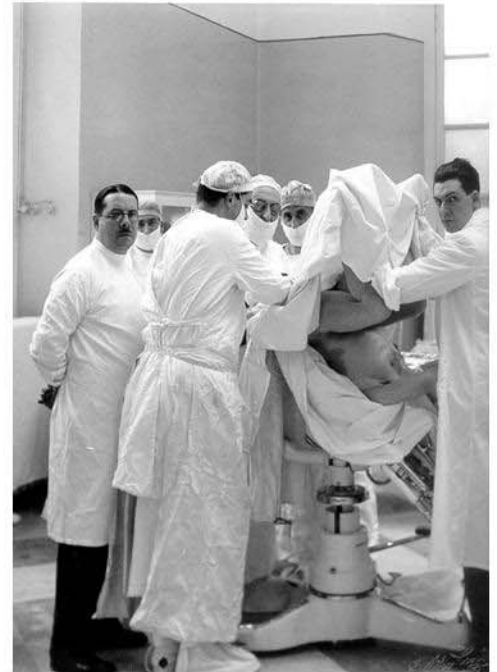
Potrebbe essere una credibile realizzazione ?